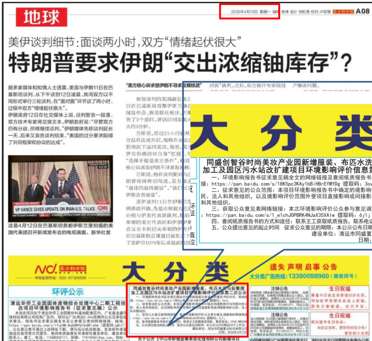
图 3.2-4 第二次报纸公开