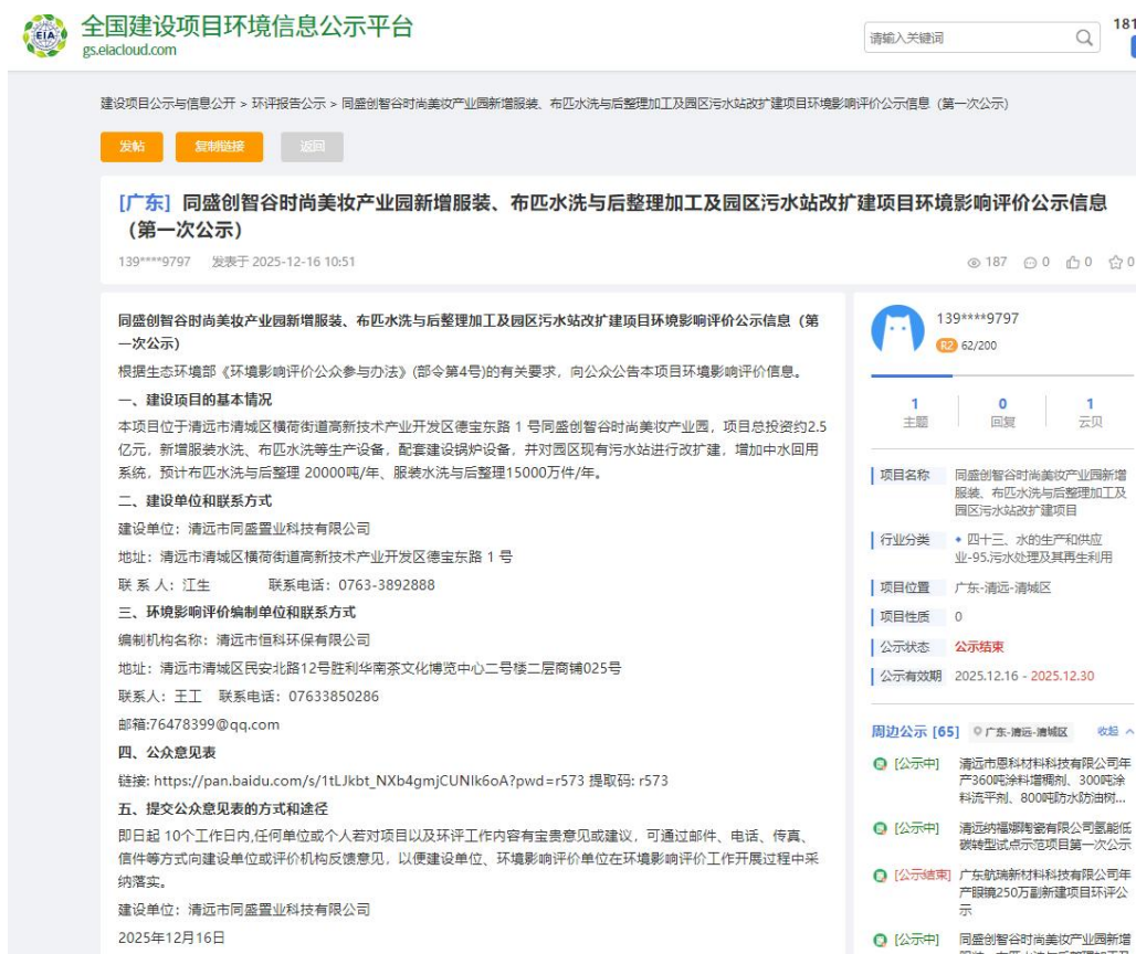
图 3.1-1 第一次网上公示截图

2025年12月16日，建设单位在全国建设项目环境信息公示平台公示了“同盛创智谷时尚美妆产业园新增服装、布匹水洗与后整理加工及园区污水站改扩建项目环境影响评价公示信息（第一次公示）”信息，公示材料内容见附件1。公示网页链接： https://www.eiacloud.com/gs/detail/1?id=51216LvBD9 。