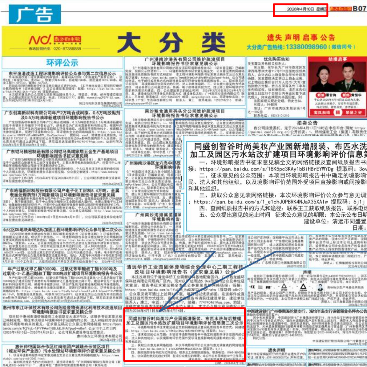
图 3.2-3 第一次报纸公开