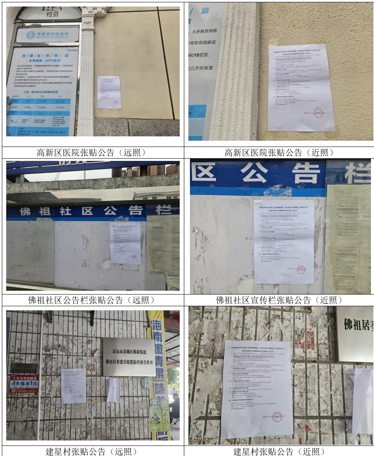
图 3.2-1 第二次现场张贴公示照片

2026 年 4 月 7 日，建设单位在全国建设项目环境信息公示平台公示了《同盛创智谷时尚美妆产业园新增服装、布匹水洗与后整理加工及园区污水站改扩建项目环境影响报告书（征求意见稿）》相关信息，公示网页链接： https://www.eiacloud.com/gs/detail/1?id=60407rcJ42 。