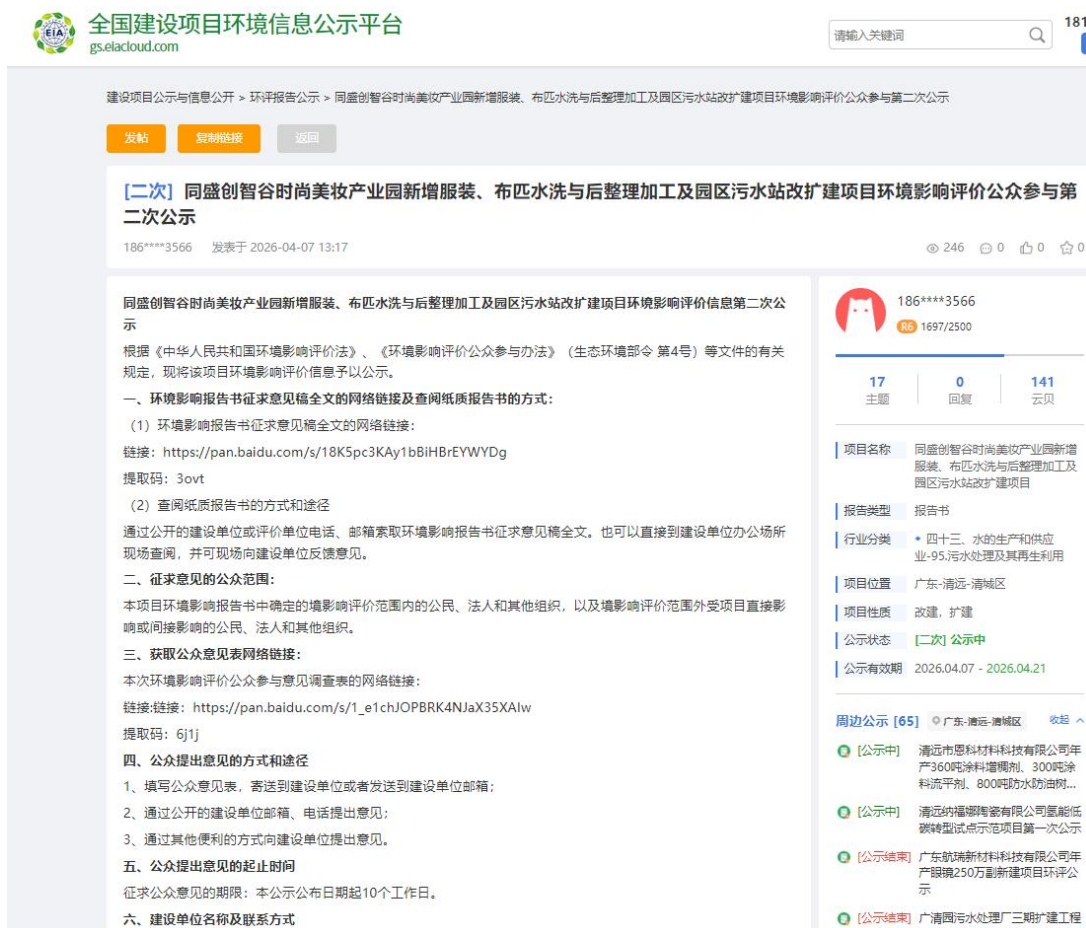
图 3.2-2 第二次网上公示截图

项目公示报纸公开情况见图 3.2-3、3.2-4。项目第一次报纸公开日期为 2026 年 4 月 10 日, 第二次报纸公开日期为 2026 年 4 月 13 日, 均刊登在《南方都市报》。