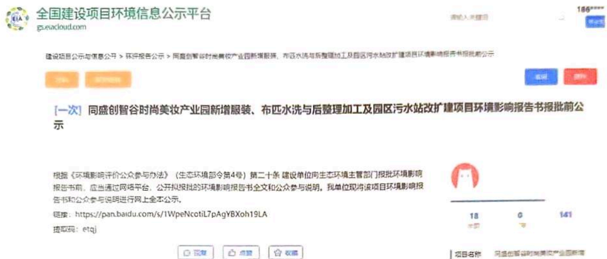
图 6-1 环境影响报告书报批前公示截图

根据《环境影响评价公众参与办法》（生态环境部令第4号）第二十条 建设单位向生态环境主管部门报批环境影响报告书前，应当通过网络平台，公开拟报批的环境影响报告书全文和公众参与说明。我单位现将该项目环境影响报告书和公众参与说明进行网上全本公示。