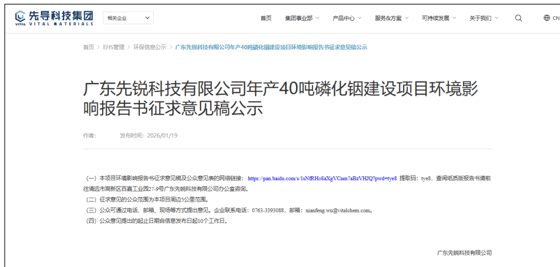
图 2 环境影响报告书征求意见稿网上公示截图

我公司“广东先锐科技有限公司年产 40 吨磷化铟建设项目”环境影响报告书征求意见稿网络公示网址为： https://www.vitalchem.com/shuju/99.html ，网络公示截图如下：