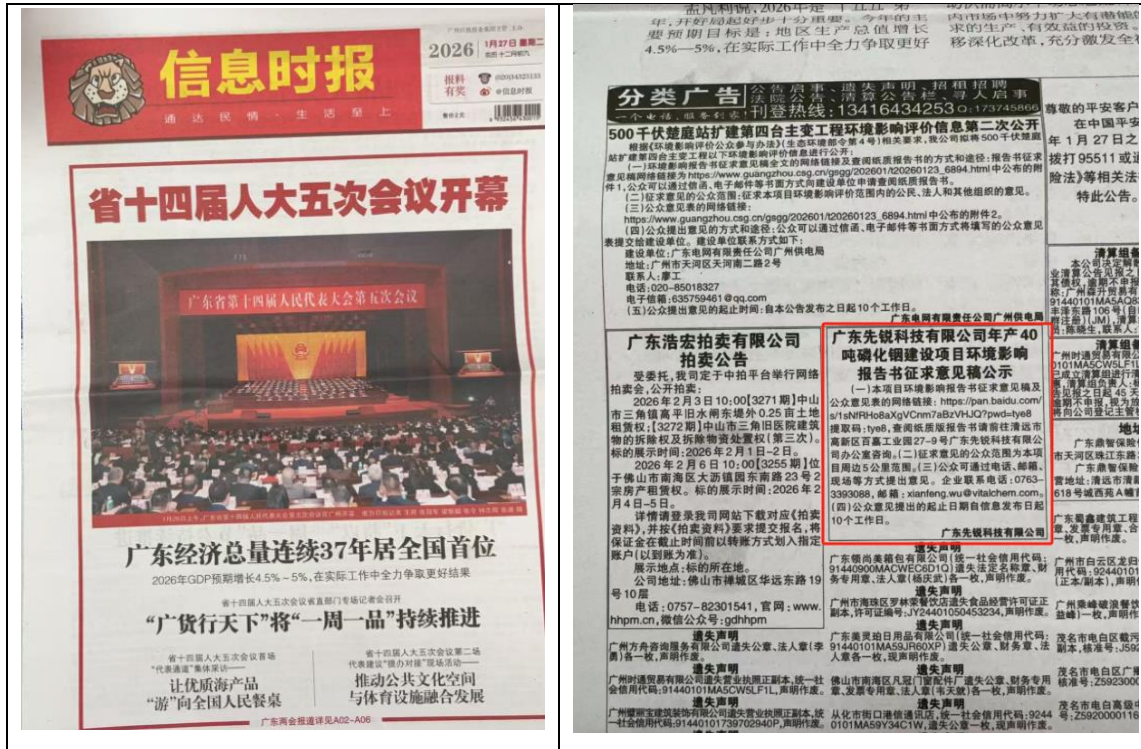
图 3 征求意见稿公示信息第一次报纸刊登公示截图

我公司“广东先锐科技有限公司年产 40 吨磷化铟建设项目”环境影响报告书征求意见稿进行两次报纸公示，2026 年 1 月 27 日第一次报纸公示照片见图 3，2026 年 1 月 28 日第二次报纸公示照片见图 4。