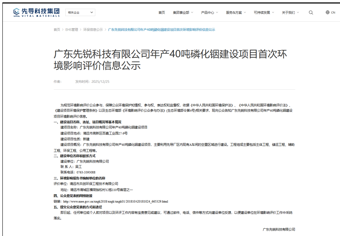
图 1 首次网络公示截图