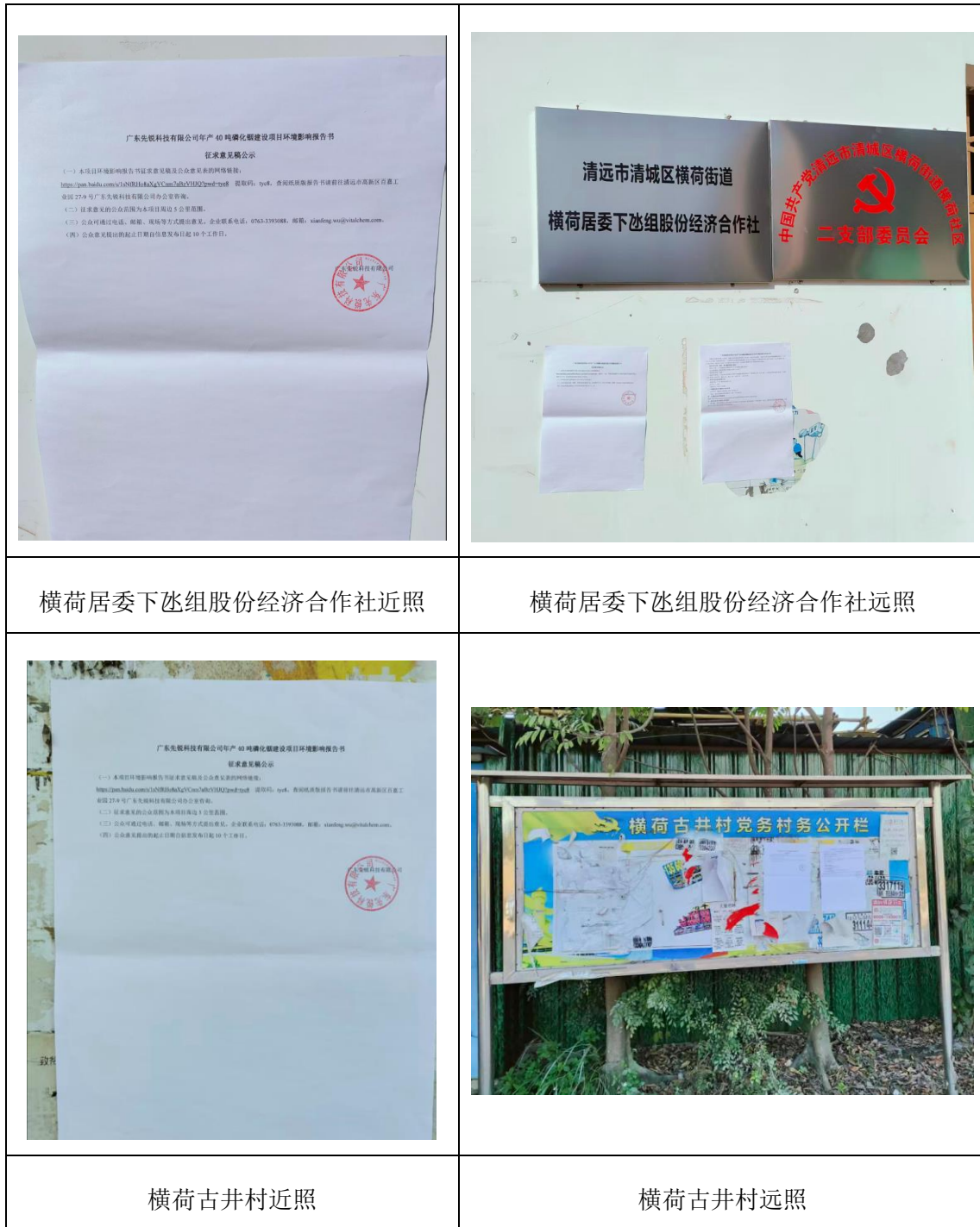
图 5 征求意见稿公示期间现场公示照片