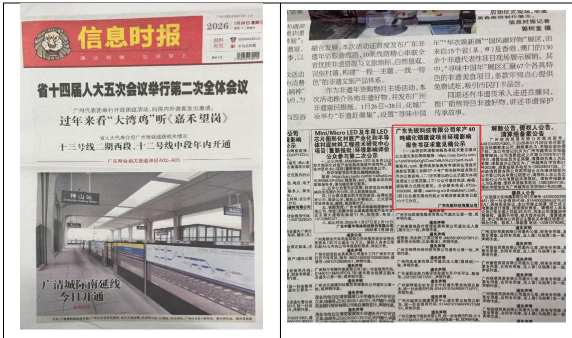
图 4 征求意见稿公示信息第二次报纸刊登公示截图